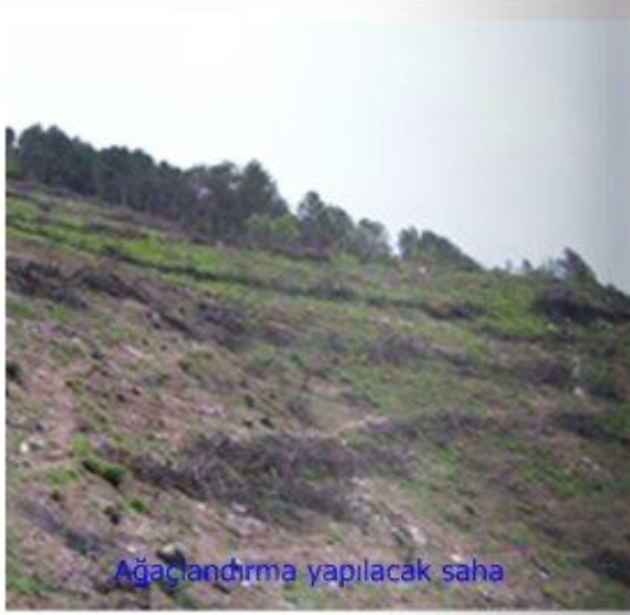
Ağaçlandırma yapılacak saha