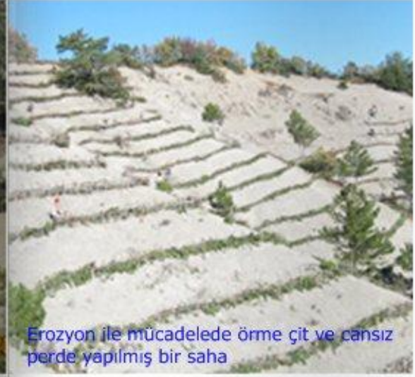
Erozyon ile mücadelede örme çit ve cansız perde yapılmış bir saha