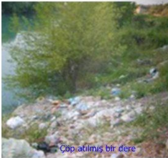
Çöp atılmış bir dere