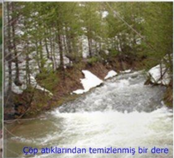
Çöp atıklarından temizlenmiş bir dere