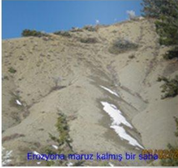
Erozyona maruz kalmış bir saha