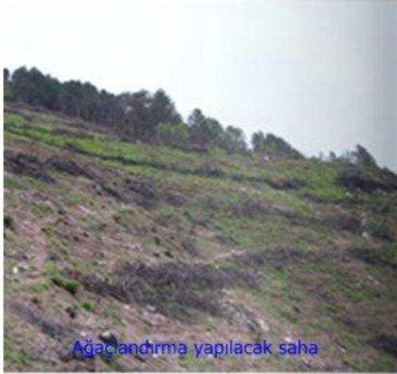
Ağaçlandırma yapılacak saha