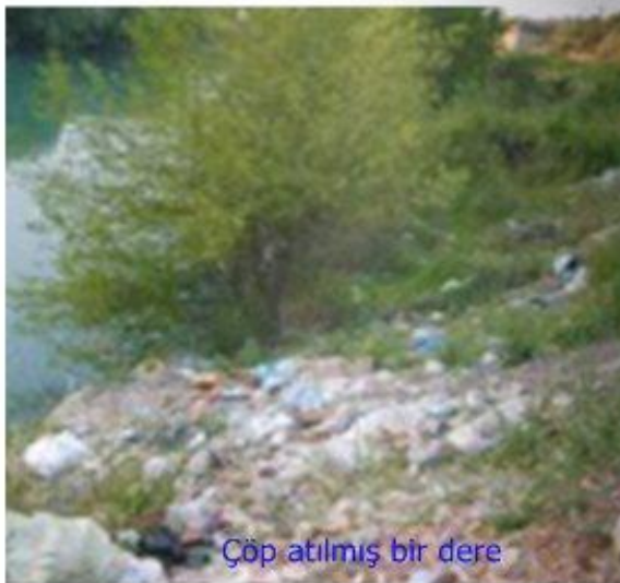
Çöp atılmış bir dere