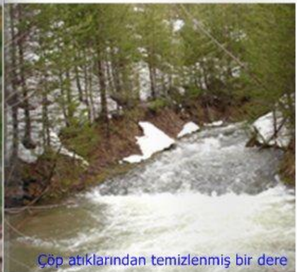
Çöp atıklarından temizlenmiş bir dere