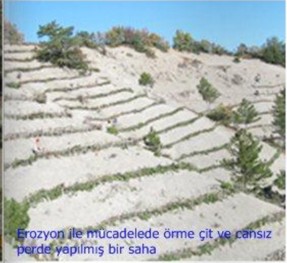
Erozyon ile mücadelede örme çit ve cansız perde yapılmış bir saha