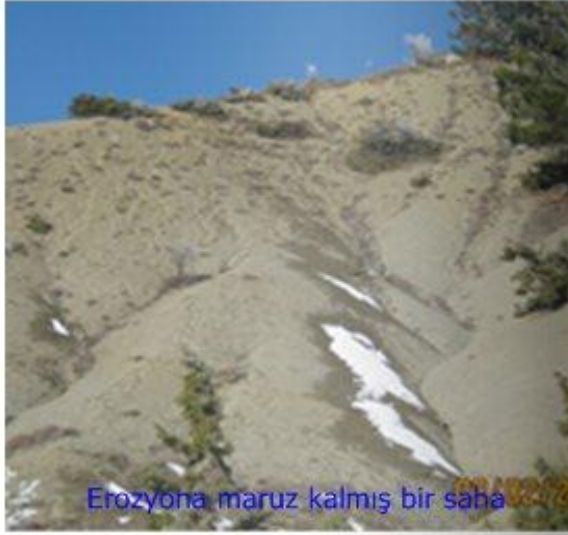
Erozyona maruz kalmış bir saha