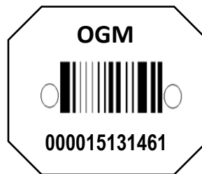
1/ç - ORKOD (Damga yerine kullanılabilcek işaretler)