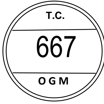
1/a - Ağaç Kesim Damgası